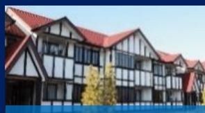
学生寮(強化指定クラブ)

本学園所有の人工芝グラウンド や連携先のサッカー場を使用し ます。 整った環境で日々の練習に取組 むことが出来ます。